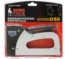
EMPAQUE (MIN: 4 PZAS)